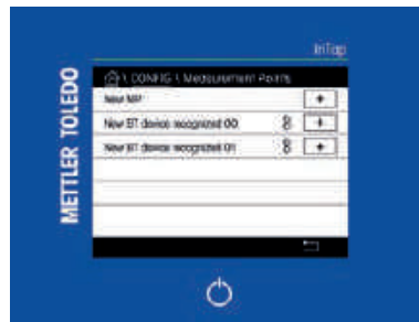
편리한 데이터 관리 기능이 제공되는 터치스크린 인터페이스