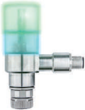
T100: Bluetooth 인터페이스 oDO 센서용.